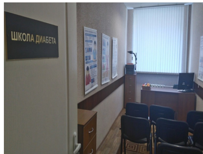
Школа для пациентов с сахарным диабетом