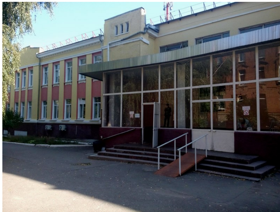
БЮДЖЕТНОЕ УЧРЕЖДЕНИЕ ЗДРАВООХРАНЕНИЯ ВОРОНЕЖСКОЙ ОБЛАСТИ «ВОРОНЕЖСКИЙ ОБЛАСТНОЙ КЛИНИЧЕСКИЙ ЦЕНТР СПЕЦИАЛИЗИРОВАННЫХ ВИДОВ МЕДИЦИНСКОЙ ПОМОЩИ» АДРЕС: г. Воронеж, ул. Каляева, д.19