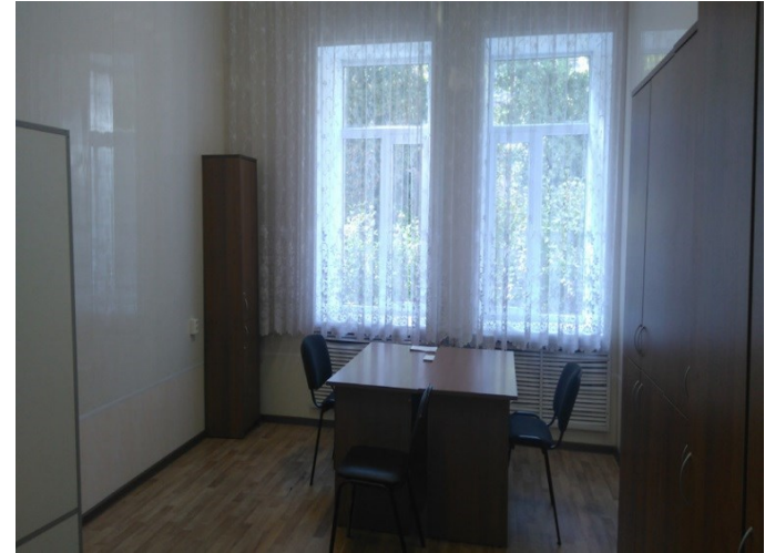
Кабинет врачебного приема