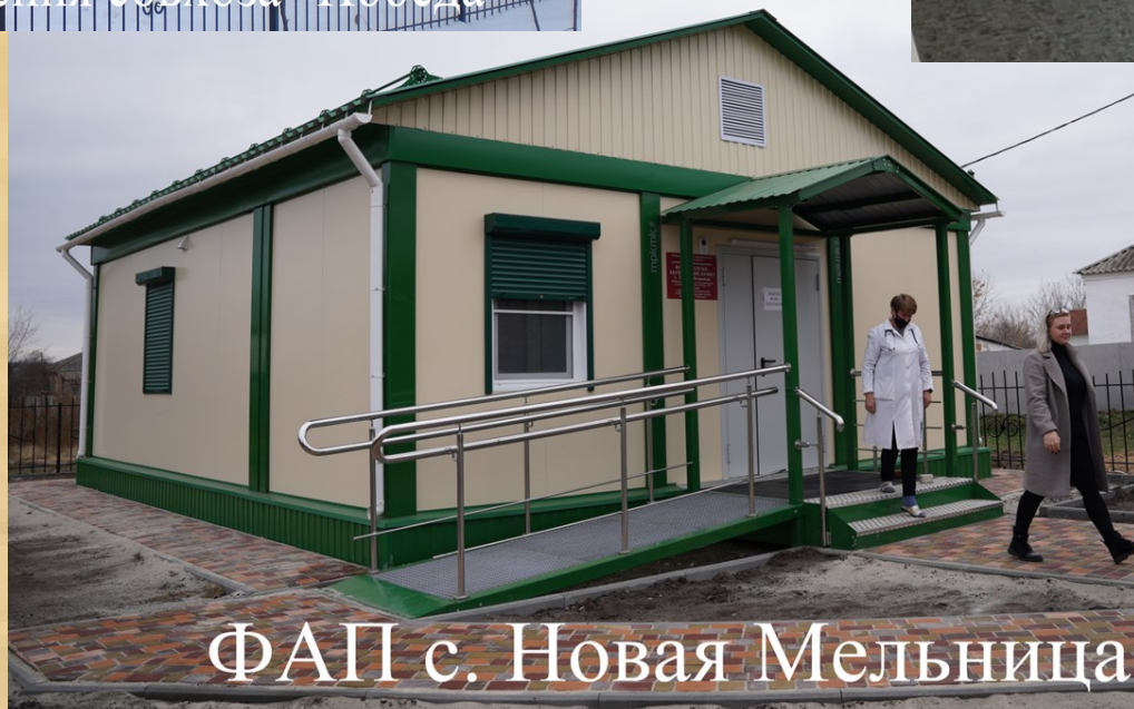
ФАП с. Новая Мельница

Заведующий фельдшерско-акушерским пунктом (фельдшер или медицинская сестра)