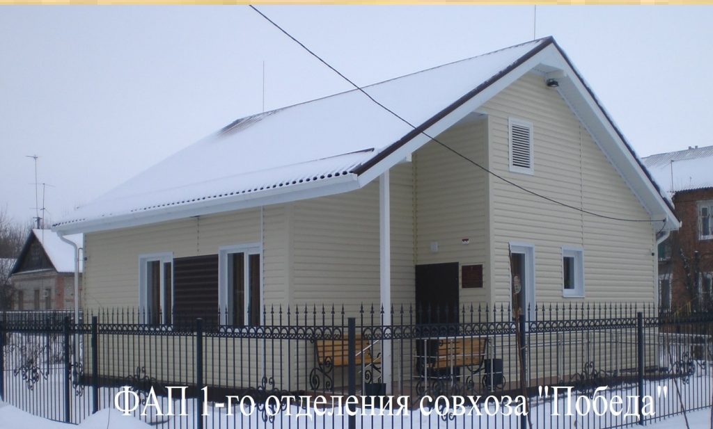
ФАП 1-го отделения совхоза "Победа"